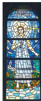
witraże w kościele parafialnym w Tywnoi